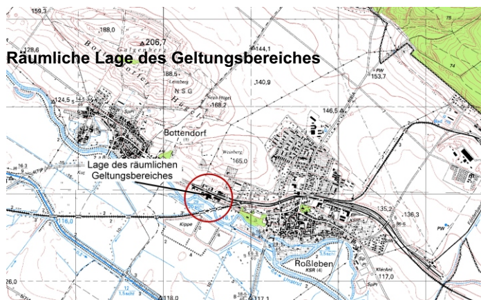
Räumliche Lage des Geltungsbereiches